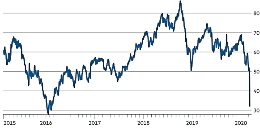
Şekil 2. Petrol Fiyatları.